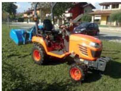
Trattorino taglia erba e spazzaneve per marciapiedi.

Come sempre, cercando di agire secondo giusti criteri e nel puntuale rispetto delle norme, oltre a quanto descritto, verrà fatto quanto essenziale per intervenire laddove necessario, con una linea di indirizzo orientata a definire e caratterizzare sempre più il nostro comune sia come "struttura" efficiente e capace, che come luogo contraddistinto dalla buona vivibilità.