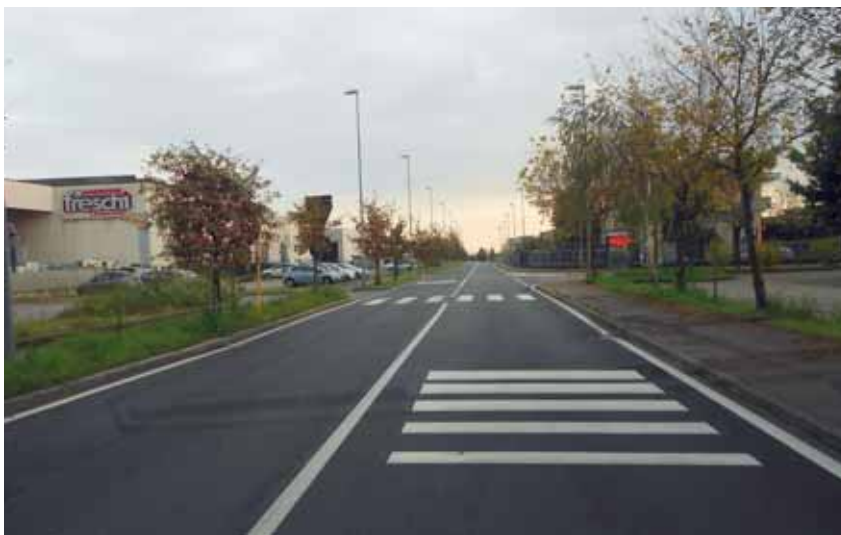
Via S. Domenico Zona PIP.

È possibile infine osservare come nelle ultime settimane si siano eseguite opere di asfaltatura su alcuni tratti della rete viaria interna al paese. Si è deciso di intervenire laddove ritenuto necessario e si comunica che non tutti gli interventi sono stati eseguiti. Nel periodo invernale non sono possibili questo genere di interventi a causa delle basse temperature. Durante il periodo prima-