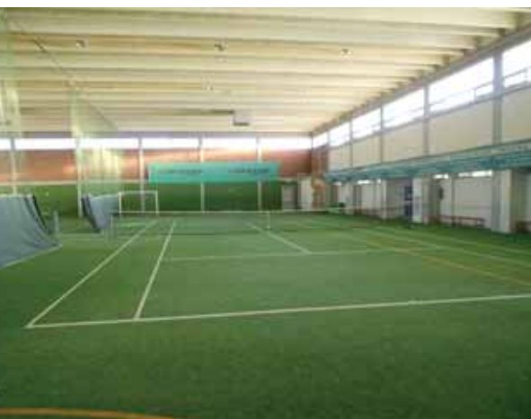
Polivalente con nuovo manto sintetico.