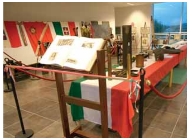
Panoramica "Museo del Ricordo".

Prima di concludere, desidero esprimere la mia gratitudine e riconoscenza a tutti i cittadini che quotidianamente si impegnano nella nostra comunità a tenere alto il senso del dovere lavorando, studiando, crescendo la propria famiglia, aiutando gli anziani e i più deboli mettendo passione e responsabilità, perché oggi è finito il tempo di lasciare agli altri, ora tocca ad ognuno di noi. Sia questo il nostro 4 novembre".