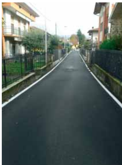
Asfalti via Tisserant.