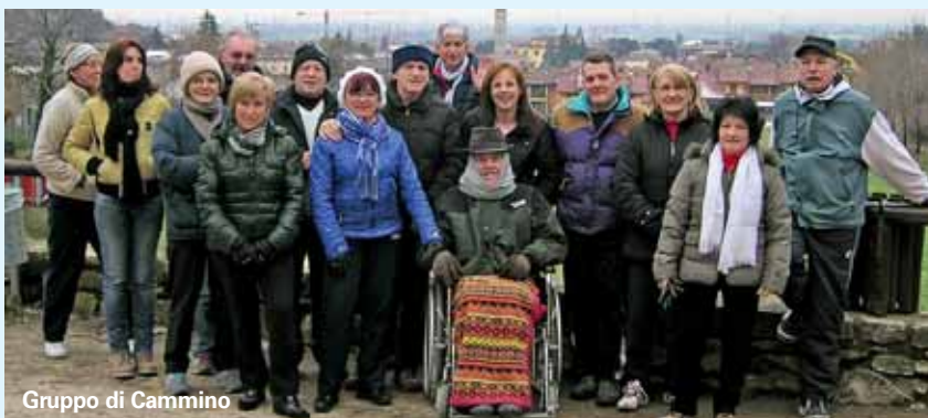
Gruppo di Cammino

essere di stimolo ed incoraggiamento per molti altri cittadini.