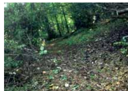
Sentiero dopo la pulizia.

mento urbanistico finalizzato a promuovere la sostenibilità energetica del sistema edilizio nel suo complesso, cioè struttura, involucro edilizio, impianti tecnologici e complementi, finalizzata alla riduzione dei fabbisogni energetici e per l'uso efficiente dell'energia.