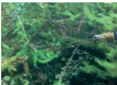
Sentiero prima interrotto da alberi.

Il primo semestre appena trascorso ha visto l'approvazione di nuovi e aggiornati strumenti urbanistici che gestiscono e contribuiscono alla pianificazione territoriale del nostro comune. È stata approvata la prima variante del Piano di Governo del Territorio. Con questa variante sono state introdotte alcune modificazioni ed integrazioni alle discipline del Piano delle Regole e del Piano dei Servizi, per dare una maggiore efficacia ad alcuni elementi procedurali, nonché rendere una più facile lettura ed interpretazione degli aspetti innovativi. Sono stati altresì inseriti alcuni nuovi elementi di disciplina che, originariamente non previsti, sono apparsi, alla luce dell'evoluzione del dibattito urbanistico, come utili completamenti della normativa e per aderire sempre più efficacemente allo sviluppo delle potenzialità innovative già insite nei principi della riforma urbanistica regionale e che sono stati precisati da provvedimenti legislativi emessi dopo la LR di riferimento. Dopo la sua adozione, è stata portata all'approvazione anche il documento energetico che costituisce un allegato al regolamento edilizio. Questo è uno stru-