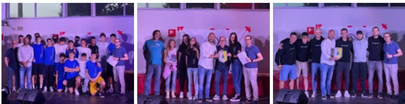
Le premiazioni degli sportivi di Brusaporto della stagione 2022-2023 nella Palestra Comunale

Per la prossima stagione, il Comune di Brusaporto conferma le tariffe per l'utilizzo delle strutture sportive comunali, da sempre improntate sull'incentivo dell'attività motoria e fisica giovanile (le palestre sono gratuite per le squadre fino ai 18 anni). Nelle prossime settimane, inoltre, il Comune stabilirà ed erogherà i classici contributi annuali a sostegno delle associazioni sportive, basati sui criteri da anni condivisi. A proposito di condivisione, l'Assessorato allo Sport condividerà e sottoscriverà nelle prossime settimane il "Piano per il diritto allo sport" per la prima volta.