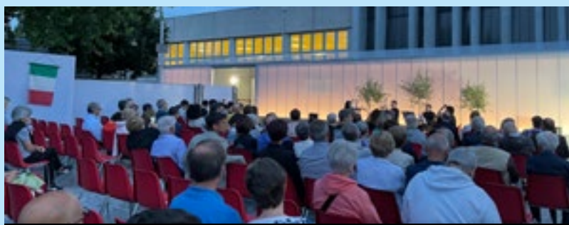
Il concerto nel piazzale del Campus Scolastico

Durante la serata il Sindaco si è rivolto a una rappresentanza dei neodicicottenni di Brusaporto presenti e ha consegnato a ciascuno di loro la Costituzione Italiana e la bandiera tricolore, in segno del loro ingresso tra gli adulti della comunità. Compire 18 anni sancisce un momento fondamentale nella vita di ogni persona: si può esercitare sì il diritto di voto, ma si diventa giovani adulti che diventano protagonisti della vita della comunità ma anche di ambiti e contesti al di fuori di essa.