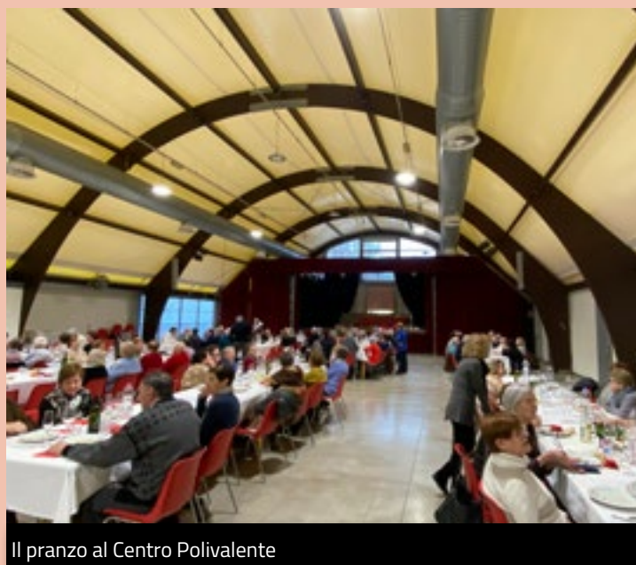
Il pranzo al Centro Polivalente