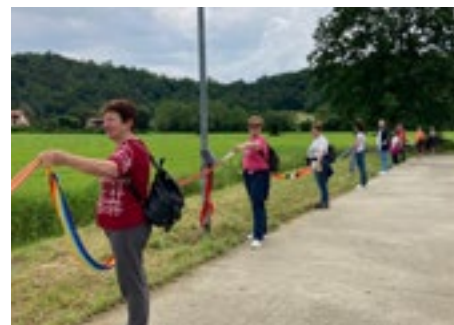
Un momento della 50 Miglia