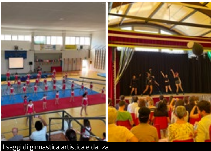
I saggi di ginnastica artistica e danza