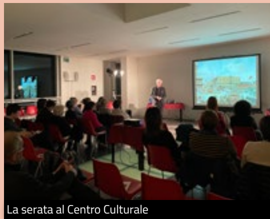
La serata al Centro Culturale

giche atmosfere della Venezia barocca, alla scoperta del ruolo delle donne veneziane, sapienti regine dei salotti letterari, decantate da artisti, poeti e illustri turisti di tutta Europa, che sono state protagoniste della vita culturale e mondana della Serenissima. Donne diverse tra loro, nobildonne, cortigiane, celebri cantanti, venerate poetesse, virtuose musiciste, ma unite dalla volontà di uscire dagli schemi della società del loro tempo. Numerose le persone intervenute alla serata e che hanno apprezzato l'esibizione.