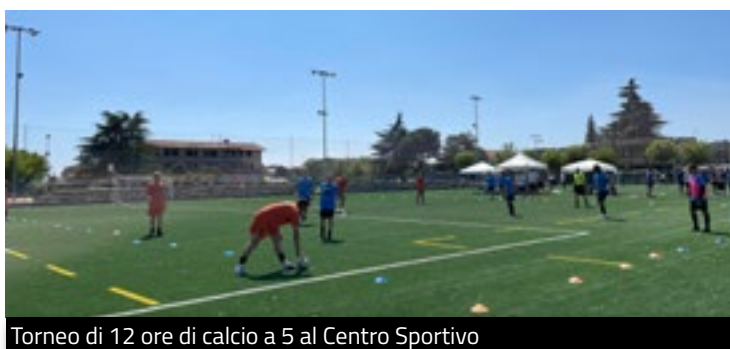
Torneo di 12 ore di calcio a 5 al Centro Sportivo