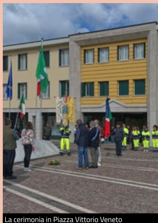
La cerimonia in Piazza Vittorio Veneto