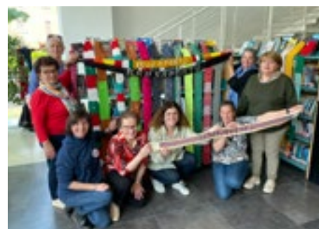
Alcune volontarie con le strisce create