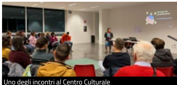
Uno degli incontri al Centro Culturale