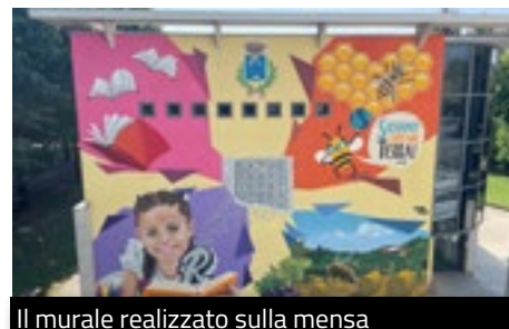
Il murale realizzato sulla mensa

Si sono conclusi a maggio gli incontri del CCRR per l'anno scolastico 2022-2023. I giovani consiglieri hanno proseguito nel loro impegno di scoperta e cura del nostro territorio. Frutto di una parte del lavoro di quest'anno scolastico è il murale, della cui esecuzione si è occupato il writer William Gervasoni (WizArt), e che è stato realizzato sulla parete della mensa che si affaccia sul Centro Culturale. Si vedono raffigurati Ric l'Ape, simbolo dell'atteggiamento virtuoso dei cittadini e nato dal lavoro dello scorso anno del CCRR; i campi e le colline di Brusaporto, considerate un valore dal punto di vista paesaggistico e come risorsa per la produzione del vino; il Sator, come simbolo emblematico presente sul territorio e dal valore storico, avvolto ancora oggi da una certa misteriosità; i libri quali omaggio alla biblioteca antistante.