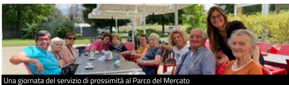
Una giornata del servizio di prossimità al Parco del Mercato