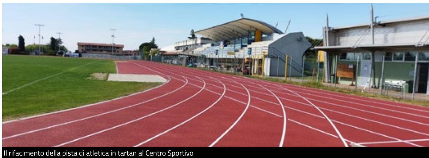
Il rifacimento della pista di atletica in tartan al Centro Sportivo

Era il 2007 quando l'allora Amministrazione Comunale, vista la forte espansione dell'atletica leggera a Brusaporto, ha deciso di impegnarsi nel progetto di realizzazione della nuova pista di atletica in tartan a sei corsie, con il rifacimento totale dell'anello di pista e della pedana del salto in lungo.