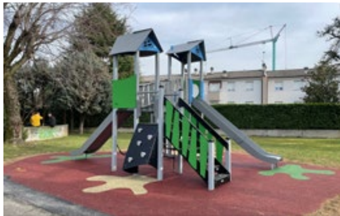
Il nuovo gioco inclusivo al Parco della Cooperazione

In seguito all'installazione del nuovo gioco inclusivo, il Comune di Brusaporto ha aderito alla rete dei parchi inclusivi istituita dal Comune di Cavernago e da oltre 50 Comuni lombardi. Scopri maggiori informazioni sul sito del progetto: www.parchipertutti.org