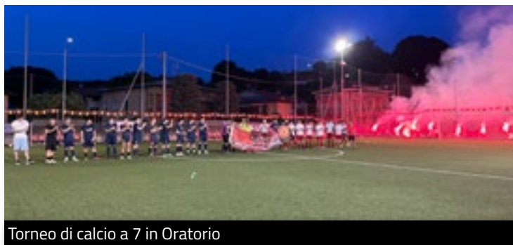
Torneo di calcio a 7 in Oratorio