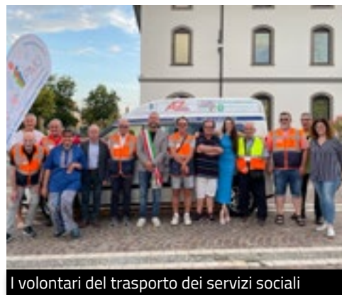
I volontari del trasporto dei servizi sociali

L'Amministrazione Comunale ha da poco deliberato il noleggio anche del secondo mezzo per averne sempre uno aggiornato. Siamo sempre alla ricerca di nuovi volontari che possano impegnarsi in questo importante ruolo. Rinoviamo i nostri ringraziamenti a tutti i volontari e agli sponsor che insieme alla ditta P.M.G. (Progetto internazionale per la Mobilità Garantita) garantiscono il proseguimento del servizio.