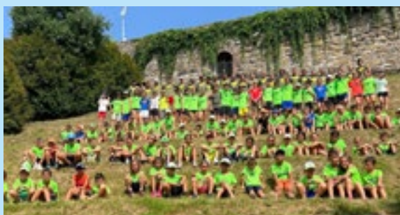
Il camp dell'ASD Atletica Brusaporto