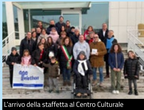
L'arrivo della staffetta al Centro Culturale

Il Comune di Brusaporto aderisce ogni anno alla raccolta fondi di Telethon a favore della ricerca medica sulle malattie genetiche rare. L'Amministrazione Comunale collabora con la Scuola Primaria e grazie ai disegni degli alunni, ogni anno dal tema diverso, è possibile comporre poi il calendario che viene poi distribuito ai brusaportesesi. Il tema di quest'anno è legato all'evento straordinario di Bergamo Brescia Capitale della Cultura 2023 e il titolo del calendario è "IncontriAmo la cultura". I disegni raccolti nel calendario raffigurano luoghi storici sia di Brusaporto che di Bergamo. A Brusaporto la raccolta fondi si è tenuta il 17 e 18 dicembre 2022, giornate precedute dalla consegna dei calendari alla scuola primaria. I fondi raccolti a Brusaporto ammontano a 2.776,10 euro. Si ringraziano i gruppi AIDO e AVIS di Brusaporto per il supporto nell'organizzazione della raccolta, le associazioni di volontariato e i cittadini che hanno donato, gli sponsor, ma soprattutto i bambini che hanno contribuito alla realizzazione dei calendari.