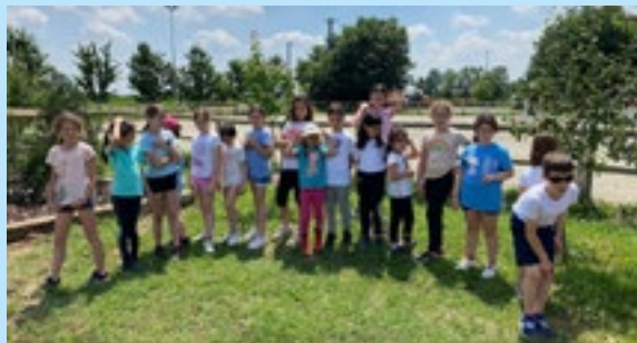
Il camp al Centro Equestre Le Valchirie

Numerosi iscritti ai camp estivi dedicati allo sport, organizzati presso il Centro Sportivo di Brusaporto dalle associazioni che già lo utilizzano durante il periodo invernale.