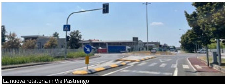
La nuova rotatoria in Via Pastrengo