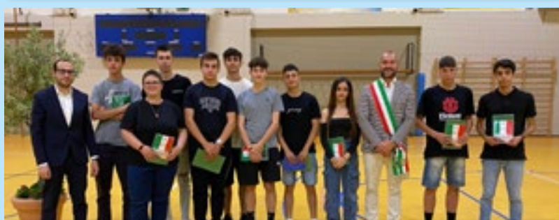
La consegna della Costituzione e del tricolore ai neomaggiorenni