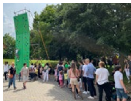
La parete per l'arrampicata