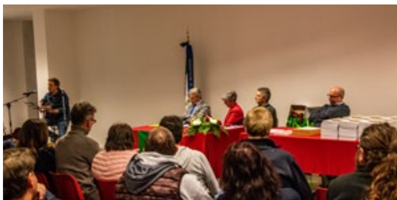
Un momento della presentazione del libro al Centro Culturale

La sezione di Brusaporto dell'Associazione Nazionale Combattenti e Reduci, nella serata di giovedì 20 aprile 2023, ha presentato il suo ultimo lavoro: un libro di ricerca, storia, racconti e fotografie dedicati alla Seconda Guerra Mondiale, con un occhio particolarmente attento a Brusaporto e ai suoi abitanti. È il secondo volume, scritto e pubblicato da ANCR, di raccolta storica sui conflitti mondiali, il primo volume riguardava il primo conflitto mondiale. Durante la serata si sono alternati momenti di illustrazione del volume e della ricerca svolta a momenti di lettura teatrale di brani tratti dalle testimonianze raccolte da ANCR dalla voce dei brusaportesi e riguardanti quel periodo drammatico e mai dimenticato.