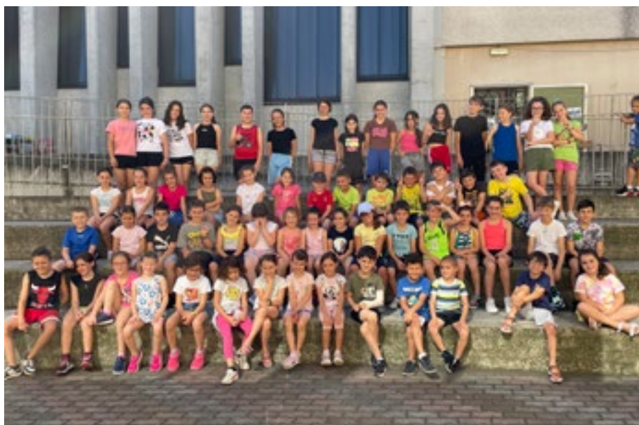
I ragazzi e le ragazze iscritti al CRE comunale

L'ultima settimana di luglio si è concluso il Centro Ricreativo Estivo comunale che anche quest'anno, con le sue sette settimane di attività, si è confermato un punto fermo per l'estate di tanti bambini e ragazzi delle scuole Primaria e Secondaria di primo grado del nostro territorio e non solo. Per il primo anno il servizio è stato affidato alla Cooperativa Città del Sole, aggiudicatrice di bando, che con i propri educatori e il supporto della leva civica messa a disposizione dall'Amministrazione Comunale ha accompagnato in questo lungo percorso i 101 iscritti che si sono avvicendati nelle settimane. Il servizio predisposto dall'Assessorato all'Istruzione offre un'occasione di incontro, di gioco e di animazione durante i mesi estivi, rispondendo ai bisogni di quei genitori, ma non solo, che hanno esigenze di carattere lavorativo e/o familiare. Le giornate sono state scandite da una programmazione che prevedeva l'alternarsi di spazi dedicati all'accompagnamento dei compiti ed altri riservati invece allo svago e al giocare insieme. Il tema "I care" è stato il filo conduttore di un viaggio alla scoperta del valore del prendersi cura: cura di sé, cura dell'altro, cura della comunità e delle istituzioni... anche aiutati dai 4 elementi: acqua, aria fuoco e terra dei qua-