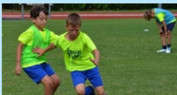
Il camp dell'ASD Calcio Brusaporto