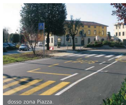
dosso zona Piazza.