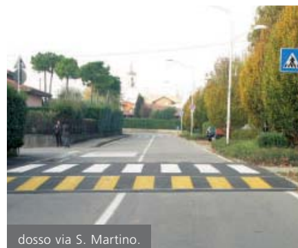
dosso via S. Martino.