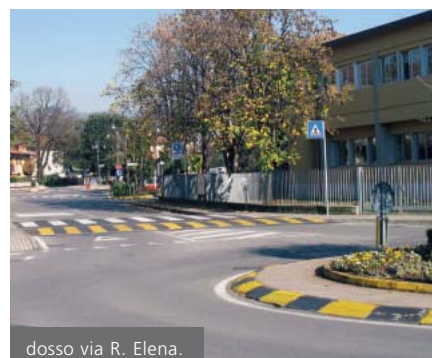
dosso via R. Elena.

In effettiva esecuzione o in procinto di esserlo ci sono interventi dedicati alla sistemazione della viabilità carrabile, pedonale e ciclabile del paese. In fase esecutiva, la sistemazione del tratto iniziale della pista ciclabile in via Fontanelli, al fine di evitare che dalla collina arrivi in strada fango e terriccio, in concomitanza di piogge intense. La realizzazione del nuovo tratto di pista ciclo-pedonale, con annessa area di parcheggio, lungo la via S. Domenico è in fase di ultimazione; la sistemazio-