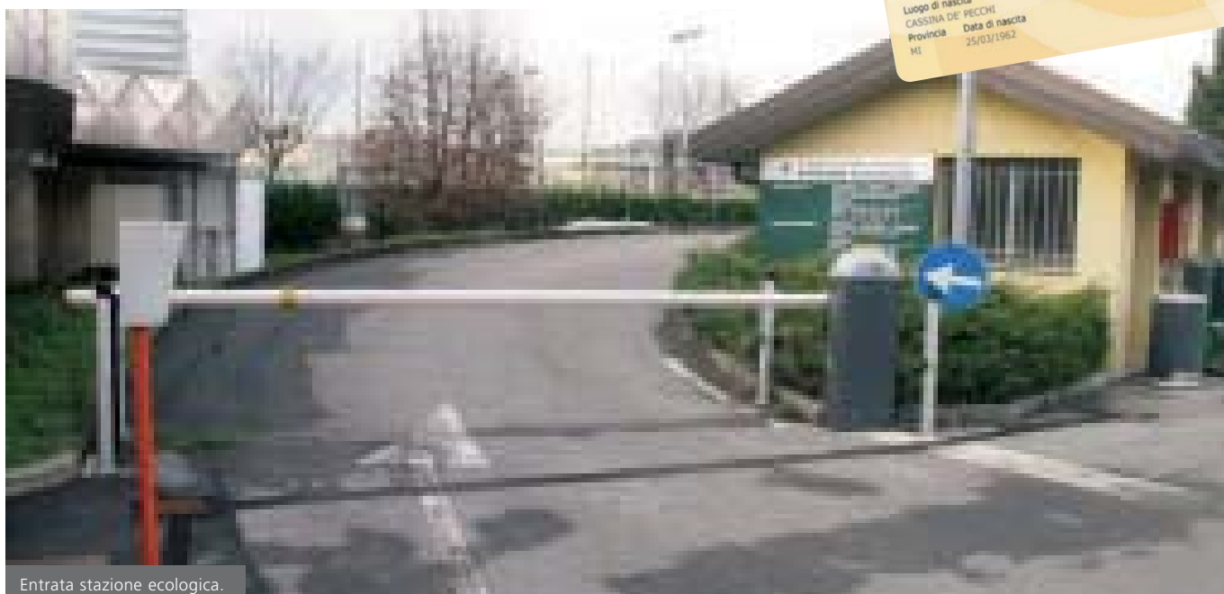
Entrata stazione ecologica.