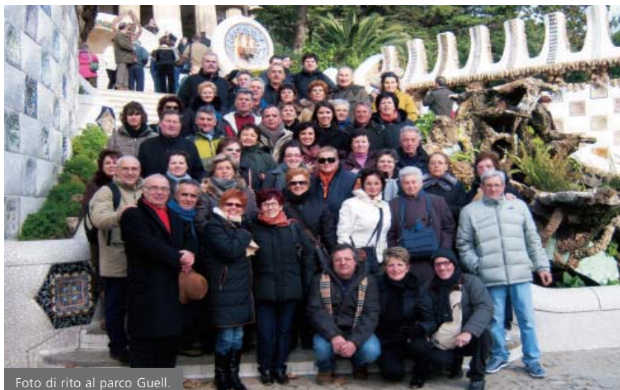
Foto di rito al parco Guèll.

Nel pomeriggio, abbiamo lasciato Girona, con negli occhi la sua immagine più emblematica, quando il sole calante illumina al meglio le case dipinte a colori vivaci che si specchiano nel fiume Onyar.