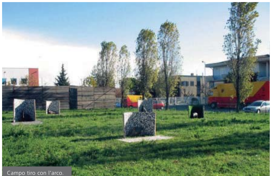
Campo tiro con l'arco.

La Coast-to-Coast è la manifestazione sportiva più massacrante che si disputa al mondo. In 25 anni, solo 164 atleti sono riusciti a terminare la gara in tempo utile. Si parte da San Diego e si entra subito nei deserti della California e dell'Arizona, dove si sfiorano i 50 gradi, poi si sale sulle fredde e altissime montagne del Colorado, dove a 3550 metri di quota le temperature sono vicine allo zero. Poi, ci sono i lunghissimi rettilinei del Kansas, il 90% di umidità del Missouri e dell'Indiana, i temporali del Middleeast: insomma pedalare per 5000 km in 20 giorni, superando 38.000 metri di dislivello, per arrivare sulla costa atlantica non è sicu-