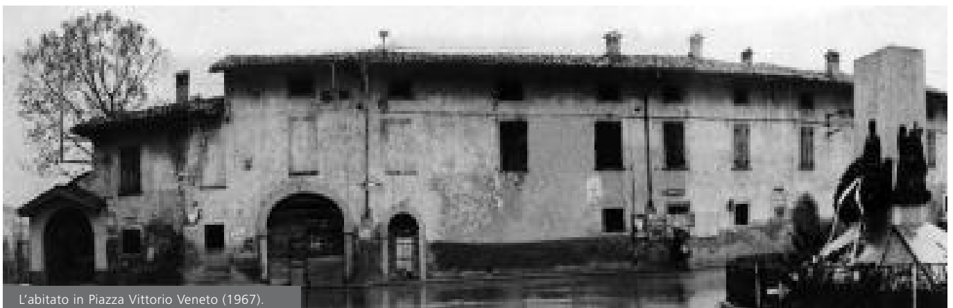
L'abitato in Piazza Vittorio Veneto (1967).