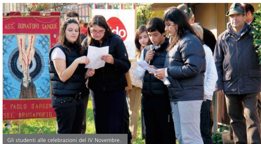
Gli studenti alle celebrazioni del IV Novembre.

Nel consiglio comunale dello scorso 30 settembre è stato approvato il Piano per il diritto allo studio per l'anno scolastico 2008-09. Il finanziamento, deciso dall'amministrazione comunale, servirà all'Istituto comprensivo e alla Scuola Materna per il funzionamento ordinario, ma anche per i progetti e le iniziative didattiche, per gli insegnanti di sostegno degli alunni diversamente abili. Il Piano prevede un finanziamento di ben