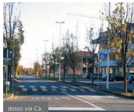
dosso via Cà.

ne del reticolo idrico lungo la pista ciclo-pedonale a monte del paese inizierà in questo periodo, così come sono in procinto di partire i lavori di rifacimento della sconnessa pavimentazione del passaggio Roncaglia.